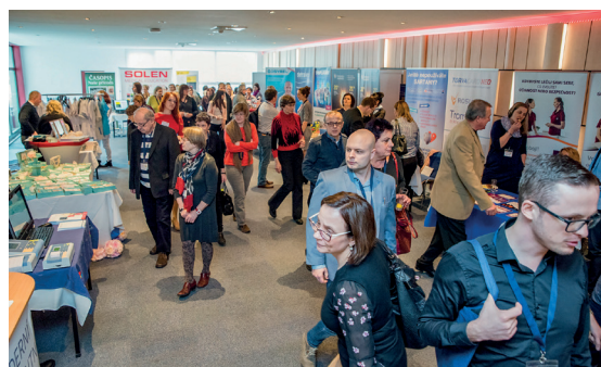
V předsáli nechyběla tradiční výstava partnerských firem