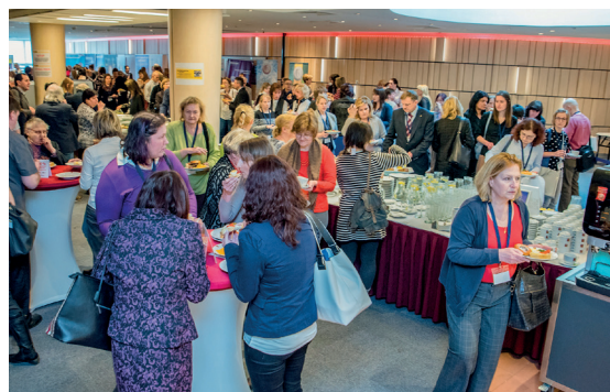
Přestávky mezi jednotlivými bloky jsou ideální příležitostí pro výměnu zkušeností z odborné praxe