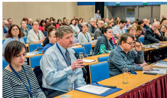
Po přednáškách se často diskutovalo