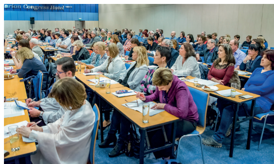
Zaplněný přednáškový sál

Poděkování patří všem partnerům za finanční spoluúčast na zajištění kongresu.