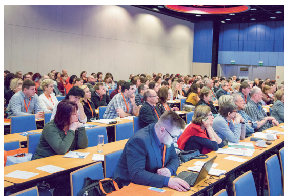
Sál byl zaplněn téměř po celou dobu trvání kongresu