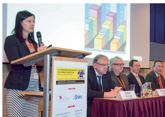
Přednášející v kardiologickém bloku