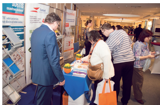
V předsáli si účastníci mohli prohlédnout výstavu partnerských firem