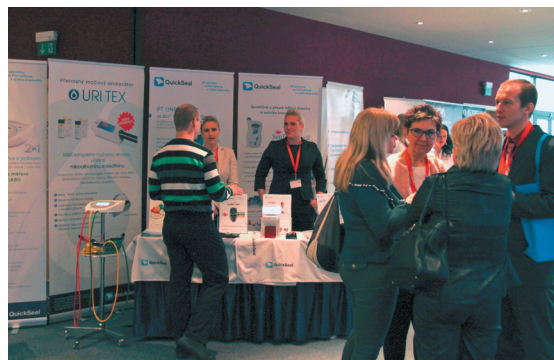
Prezentace firem v předšálí