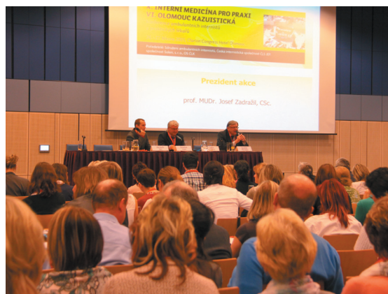
Tematický blok kardiologie