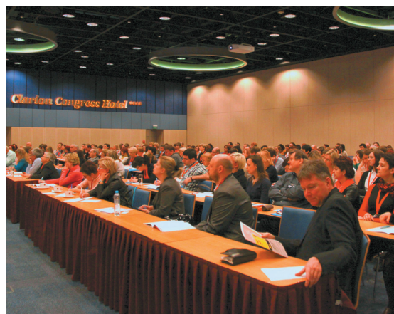
Přednáškový sál byl téměř neustále úplně zaplněn